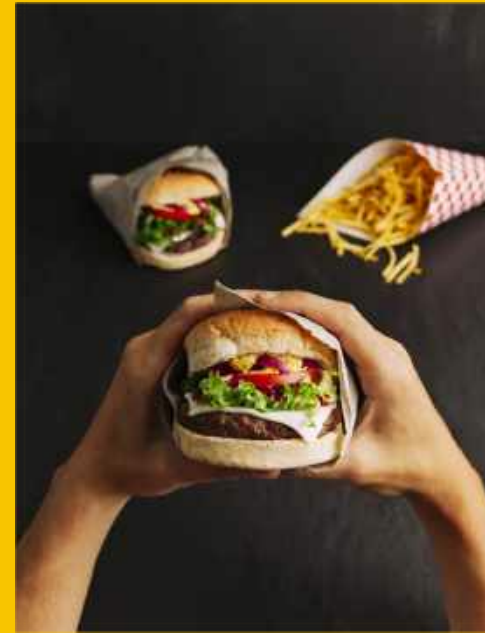
BURGER DI MACINA DI CARNE DI FASSONA PIEMONTESE